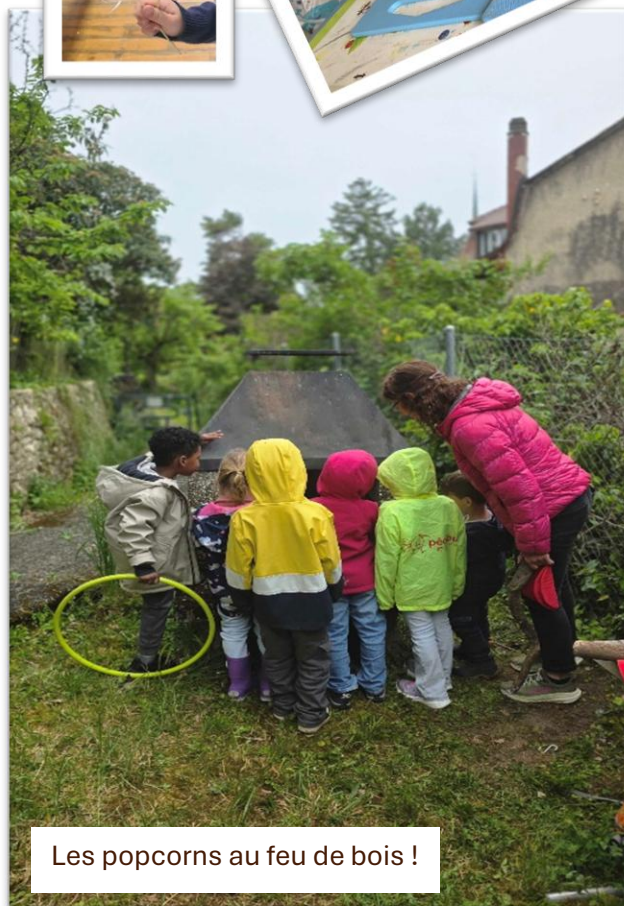
Les popcorns au feu de bois !