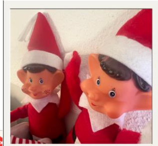
Cata et Strophe

Chaque jour de décembre, les enfants ont découvert une nouvelle farce concoctée par nos lutins, Cata et Strophe. Ces deux-là ont une imagination débordante pour faire rire les enfants comme les adultes !